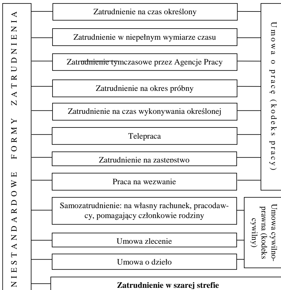
Wykres 1. Niestandardowe formy zatrudnienia