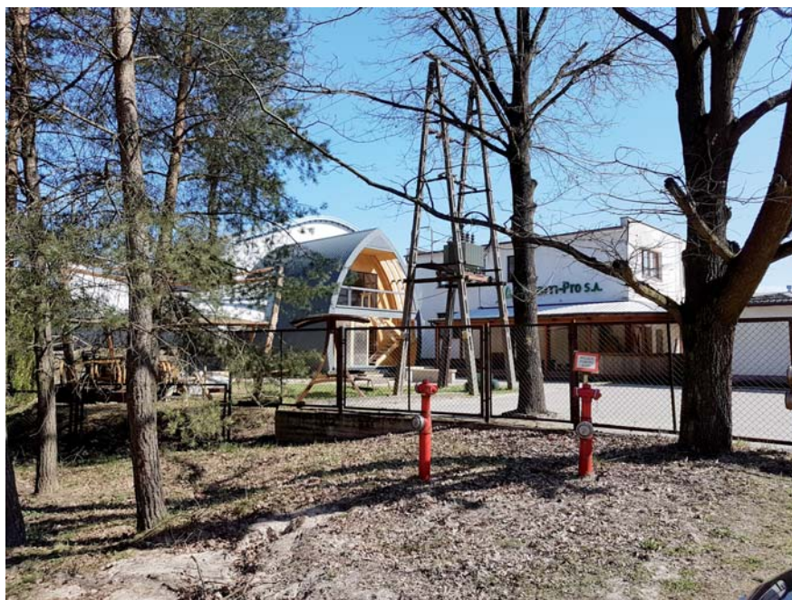
Fot. 46. Obiekty przemysłowe – Susz