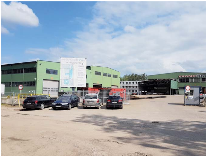
Fot. 48. Strefa przemysłowa w Czarnej Białostockiej