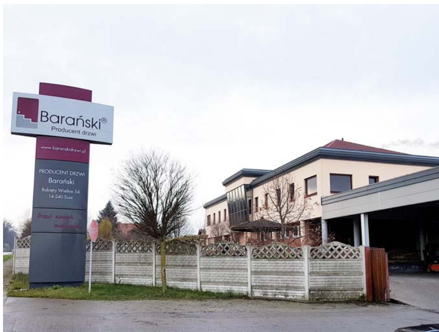
Fot. 45. Funkcje przemysłowe w Suszu