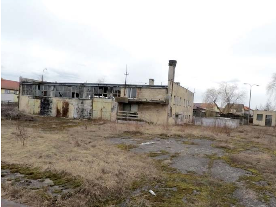
Fot. 47. Szczuczyn – planowana strefa przemysłowa