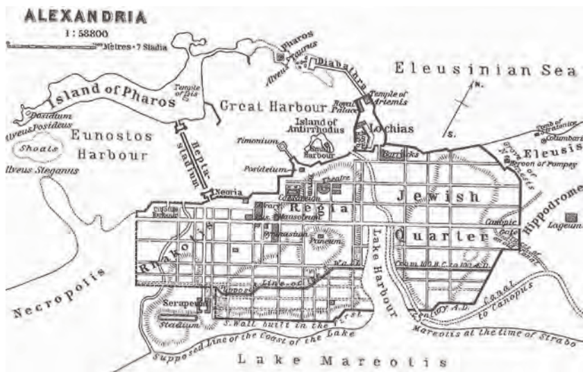
Fot. 8. Plan starożytnej Aleksandrii zawierał kompletny program miejski.

Podstawowe ekonomiczne i prawne zasady zarządzania miastem są dorobkiem średniowiecza. Pierwsze karty i prawa miejskie powstały w XI w. we Flandrii. Ekonomiczne regulacje prawne – podatki, regu-