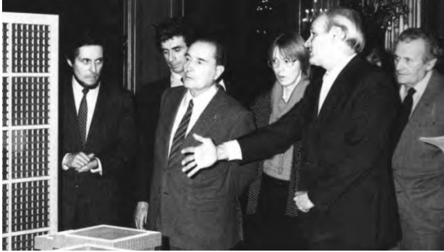
Fot. 10. Architekt Sperckelsen wyjaśnia Prezydentowi Mitterrandowi i Ministrowi kultury koncepcję Grand Arche .

Również zreformowanie polskiej gospodarki przestrzennej to zadanie i odpowiedzialność rządzących. Można mieć nadzieję, że tym razem, ostatnio podejmowane próby ustanowienia racjonalnego zestawu praw gospodarki przestrzennej zakończą się sukcesem.