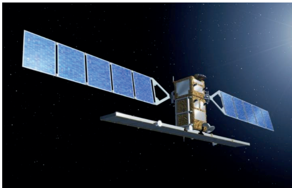
Rys. 3.2. Satelita Sentinel-1A (Sentinel.esa.int) Fig. 3.2. Satellite Sentinel-1 A (Sentinel.esa.int)

Sentinel-1 na swoim wyposażeniu ma instrument radarowy SAR, obrazujący w paśmie C, który operuje na częstotliwości środkowej 5,405 GHz. Wyposażony jest w aktywną antenę z fazowym układem, która umożliwia skanowanie wysokościowe i azymutalne (rys. 3.2). Sentinel-1 działa w czterech trybach akwizycji danych, których parametry zawiera tablica 3.2